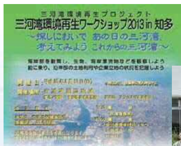
ワークショップチラシ

流域全体で三河湾浄化の取組を活性化するため、沿岸域の現状等について山から海につながる流域各地に情報発信するワークショップや現地観察会を開催。