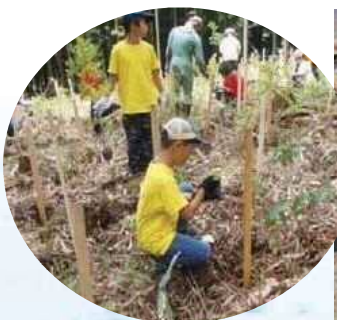
岐阜県加子母水源地の森づくり