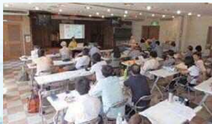
山川里海セミナー