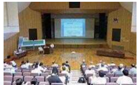
ワークショップの講演