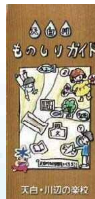
天白川ものしりガイド