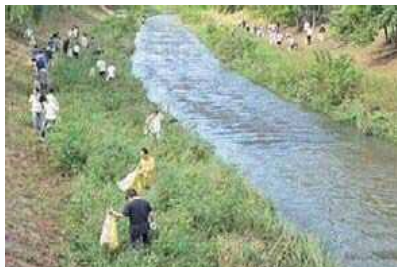
大山川クリーンアップ行事