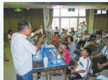
ワークショップでの水質講座