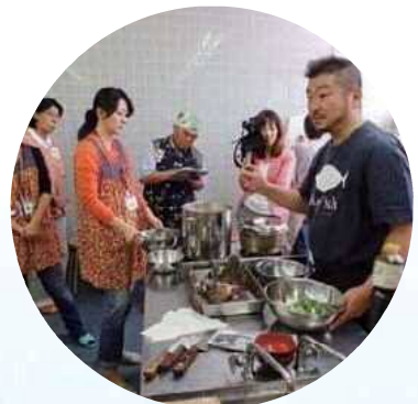
「味わって知る 私たちの海」の開催