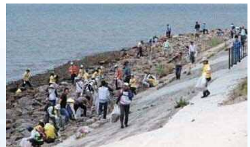
藤前干潟クリーンアップ大作戦