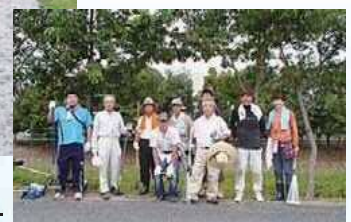
大山川の草刈りメンバー