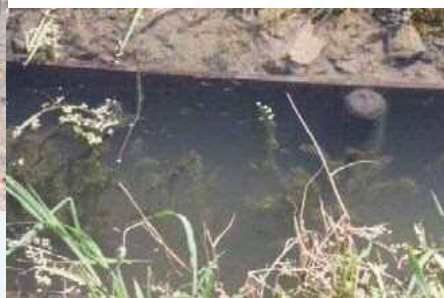
実験田水路を泳ぐメダカの群れ