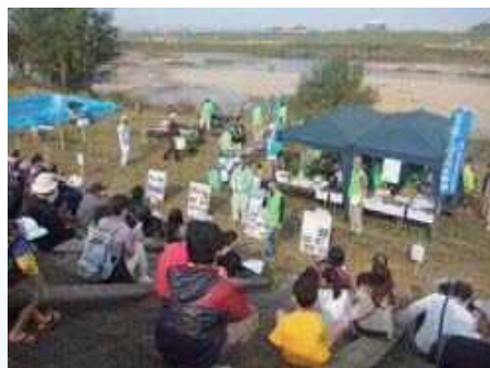
庄内川まつり・魚釣り大会