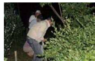
ホタルの飛翔数調査