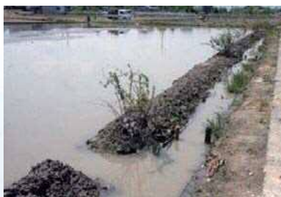
水田と水路の水がつながる実験田