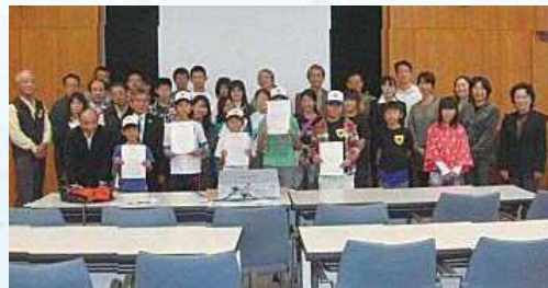
環境フォーラムの集合写真