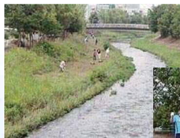
大山川の草刈り風景