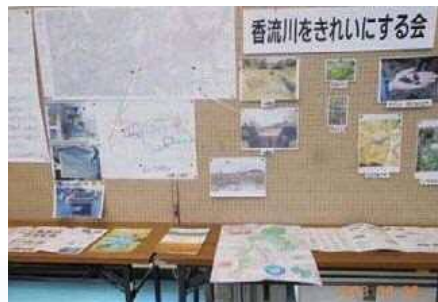
「エコフェスタ名東」での展示