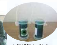
大気捕集カプセル