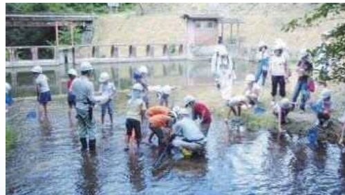
東大演習林での水生生物調査

平成19年度にテーマ「水の自然と健康」と題して第1回目を開催。学識者による基調講演やパネルディスカッション、そして、地域住民との交流会などを実施しています。