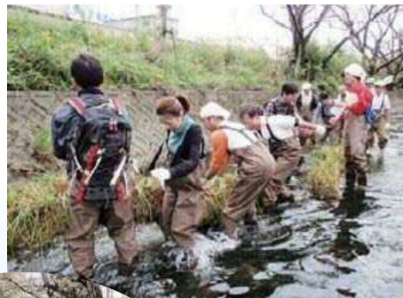
五条川の水生植物植栽

五条川を生きもの豊かな川に再生するため大口町内での五条川の一部で水生植物植栽を実施。近隣の小学校の子供達や一般市民とともに活動を行っています。