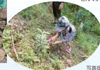
マイどんぐりを 東栄町植林地へ