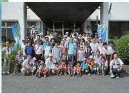
ワークショップ参加者の集合写真