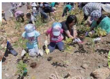
宮城県岩沼市「千年希望の丘植樹祭」