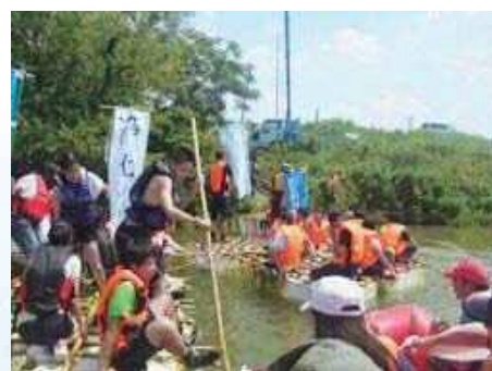
庄内川を筏で川下り