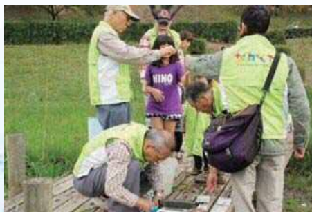
沓ヶ池の 水質調査の様子