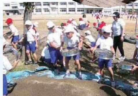
学校ビオトープ整備