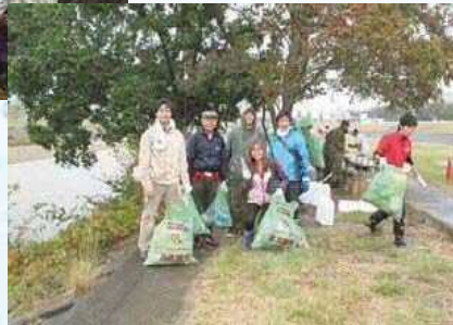
矢田川の清掃活動