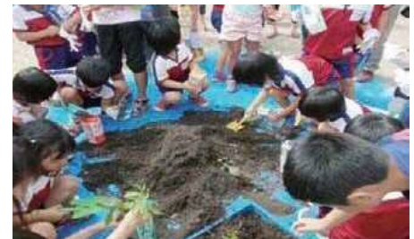
どんぐりウォーカー苗木づくり

子供たちとともに、苗木づくりで沙漠緑化再生を学ぶなど、沙漠緑化再生活動を行っています。また、日本語や生物多様性についても学んでいます。