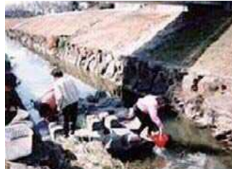
河川水質調査(水の採取)

調査結果や学習結果を消費生活展で発表。生ごみ処理講座。リフォーム小物講座。フリーマーケット運営。