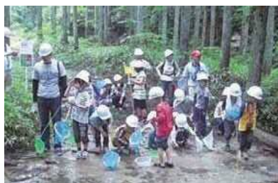
東大演習林での生物調査