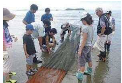
三河湾の豊かさを体験する地引き網体験