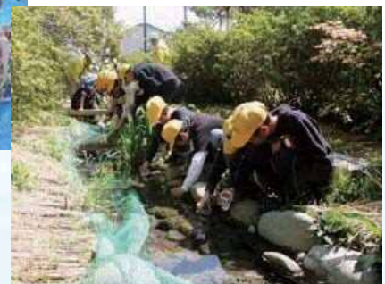
小学生による幼虫放流