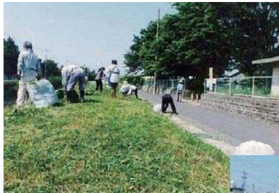
地蔵川の清掃活動

水質調査は1ヶ月毎にCOD、pH、透視度の3項目を調査しています。また、河川の水質やゴミの不法投棄を監視するために、各町内の地域住民とともに河川パトロールを行っています。