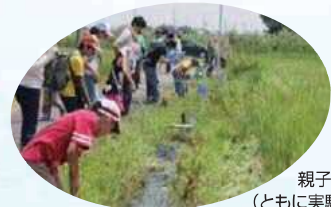
親子自然観察 (ともに実験田にて)