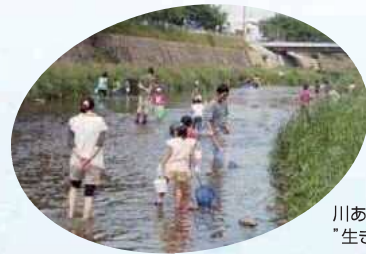
川あそび “生きもの見つけ”