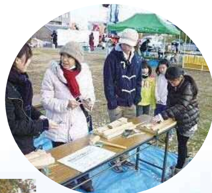
箸作りの工作教室