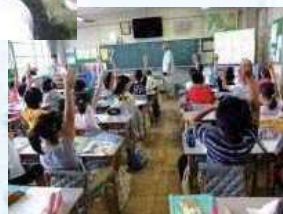
小学校の総合学習の支援