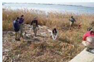
ヨシ原の生物調査