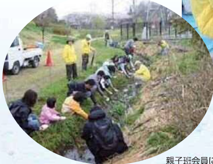
親子班会員によるホタルの幼虫の放流