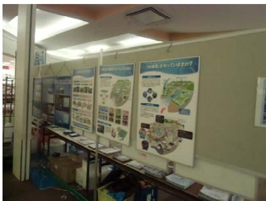
イオン大高店 展示コーナー