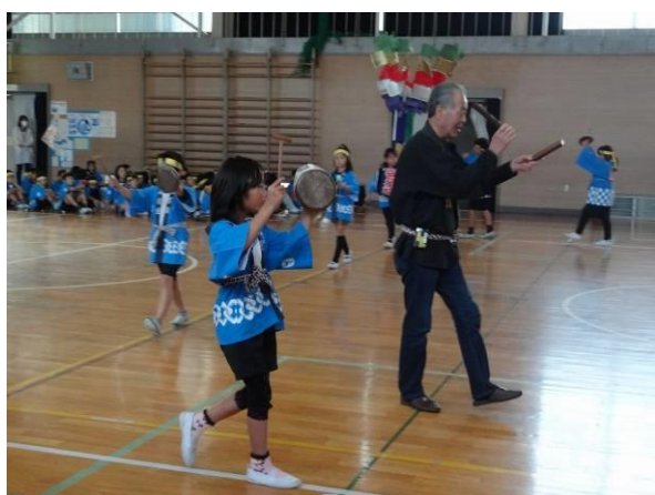
一宮市立北方小学校