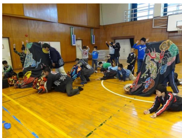
半田市立宮池小学校