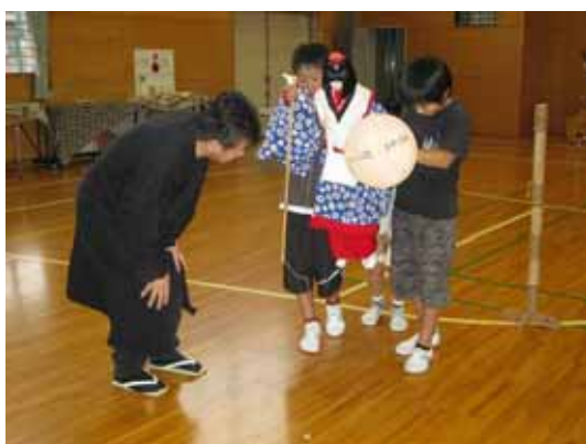
知立市立知立小学校