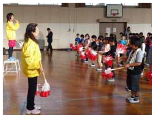
尾張旭市立旭丘小学校