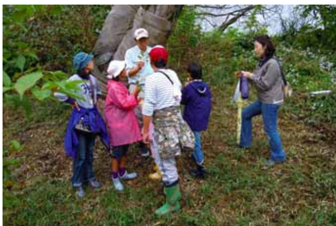
平成23年度サクラ保護体験講座の実施状況