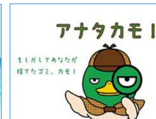
三重県 普及啓発動画