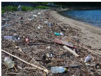
海岸に漂着したプラスチックごみ