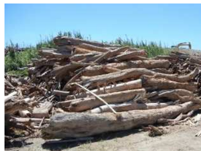
大雨後に港で回収された流木

流域圏での海洋ごみ対策の推進により、伊勢湾の良好な景観や海洋環境の保全を図ることを目的に、岐阜県・愛知県・三重県が共同で本計画を策定