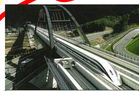
「リニア中央新幹線」