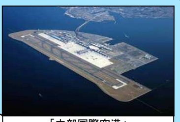
「中部国際空港」 24時間利用可能な国際空港 二本目滑走路の整備