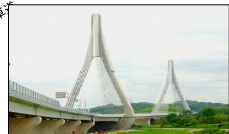
「新東名高速道路」 日本の交通の要衝として道路網が充実