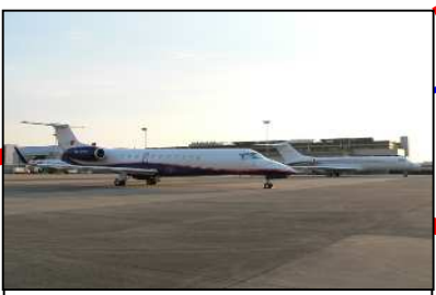
「県営名古屋空港」 通勤航空、ビジネス機、 小型機の拠点空港