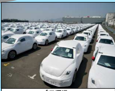
「三河港」 日本一の自動車流通港湾