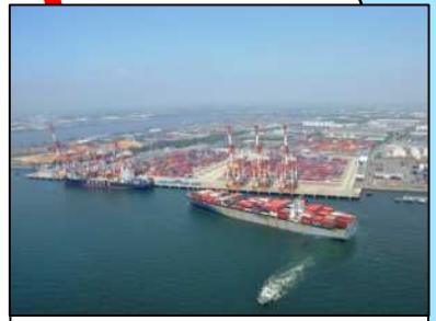
「名古屋港」 総取扱貨物量日本一の総合港湾