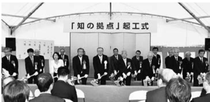
起工式での参加の様子(4月30日)

愛知県では、次世代モノづくり技術の創造・発信拠点となる「知の拠点」づくりを愛・地球博記念公園隣接地(リネモ「陶磁資料館南駅」北側)に進めています。この「知の拠点」では、産・学・行政による共同研究開発の場となる「先導的中核施設」やナノテクノロジー(超微細技術)の研究開発に欠かせない最先端実験施設である「シンクロtron光利用施設」を整備するとともにテーマと期間を定めた戦略的な産学共同研究開発プロジェクト(重点研究プロジェクト)を実施します。