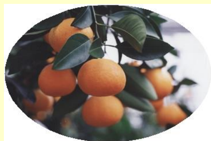
省エネ管理技術と慣行栽培の品質と収量 調査日：2015年7月