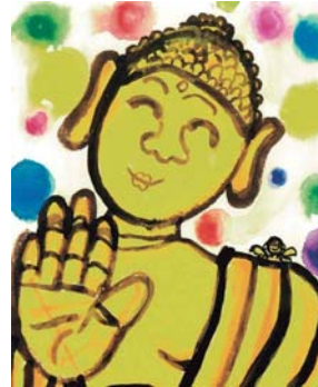
「ピッカピカの大仏様」 小学6年生 男子