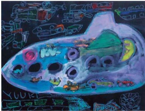
「オカリナ」 小学6年生 男子