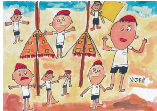
「火の粉」 小学5年生 男子

発達障害のある人は、生まれつきものごとの感じ方やとらえ方がユニークなため、とても得意なことがあるのに、ちょっとしたことがすごく苦手…というかたよりがあったりして、誤解されやすく、とても困っています。