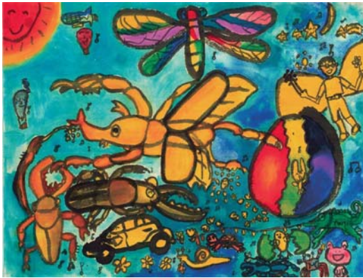
「不思議な卵」 小学6年生 男子